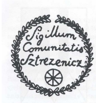
Historická obecná pečat' Streženíc

Najstaršia zachovaná obecná pečat' nemá datovanie. Použitá bola v roku 1860. Priemer pečate je 30 mm. V dolnej časti pečatného poľa je malé koleso voza, nad tým je kurzivou v troch riadkoch legenda: Sigillum Comunitatis Sztrezenicz . Vonkajší okraj pečate tvorí široká listovka. Odtlačok nedatovaného typária je uložený v Ústrednom archíve geodézie a kartografie v Bratislave.