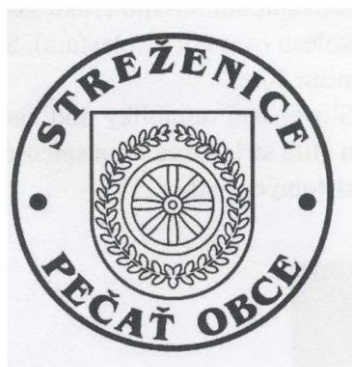
Obecná pečat' s kruhpisom

Pečat' obce je okrúhla, uprostred s obecným symbolom a kruhpisom OBEC STREŽENICE s priemerom 35 mm.