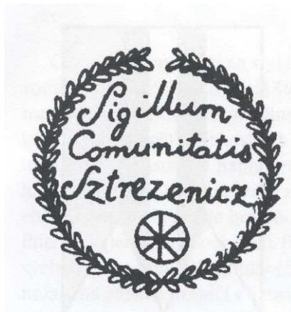
Historická obecná pečat' Streženíc

Najstaršia zachovaná obecná pečat' nemá datovanie. Použitá bola v roku 1860. Priemer pečate je 30 mm. V dolnej časti pečatného poľa je malé koleso voza, nad tým je kurzívou v troch riadkoch legenda: Sigillum Comunitatis Sztrezenicz . Vonkajší okraj pečate tvorí široká listovka. Odtlačok nedatovaného typária je uložený v Ústrednom archíve geodézie a kartografie v Bratislave.