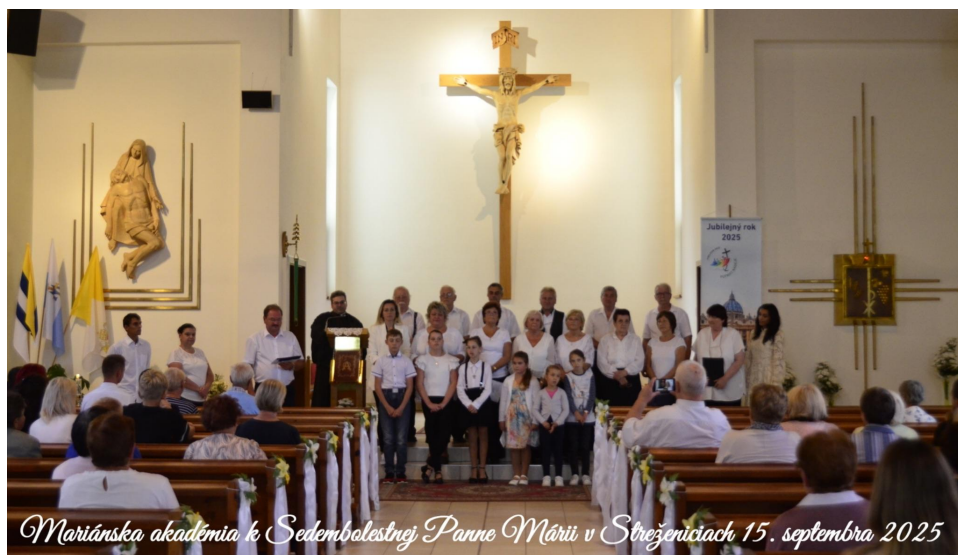
Mariánska akadémia k Sedembolestnej Panne Márii v Streženiciach 15. septembra 2025