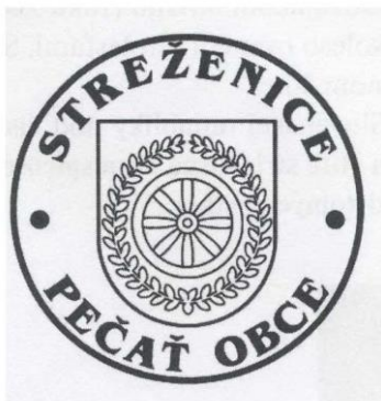
Obecná pečat' s kruhopisom

Pečat' obce je okrúhla, uprostred s obecným symbolom a kruhopisom OBEC STREŽENICE s priemerom 35 mm.